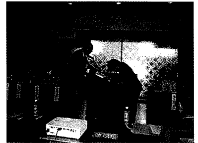
(高崎地区安全衛生大会)